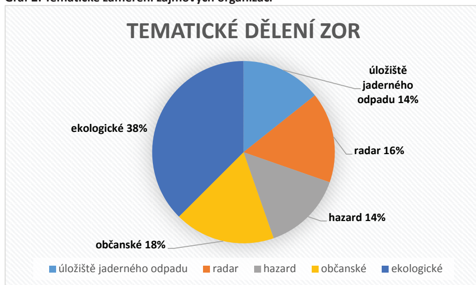
Graf 2: Tematické zaměření zájmových organizací